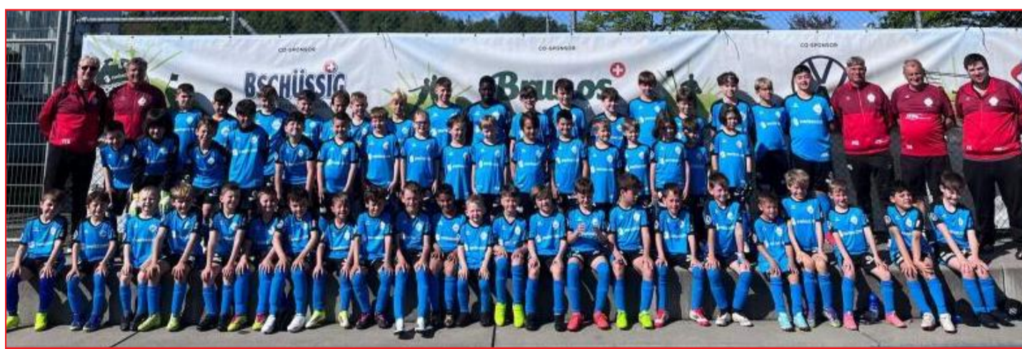
Gruppenfoto des Swisscom Footballcamps in Rümlang: Die Kinder hatten viel Bewegung und eine Menge Spass.

MS Sports bietet als Sport- und Eventagentur schweizweit über 420 Camps in neun verschiedenen Sportarten an. Ob Sportneuling oder Supertalent, alle Kids zwischen 6 und 15 Jahren (Jahrgang 2011 bis 2020) sind willkommen und werden entsprechend ihren Fähigkeiten gefördert. Doch nebst den individuellen Fortschritten, stehen vor allem der Spass und die Freude an der Bewegung im Mittelpunkt. Es gibt weitere Camps in der Nähe, wie etwa das Fussballcamp in Wallisellen (13. Juli bis 17. Juli) oder das Racketcamp in Dielsdorf (11. August bis 14. August). Infos und Anmeldung unter www.mssports.ch . (e)