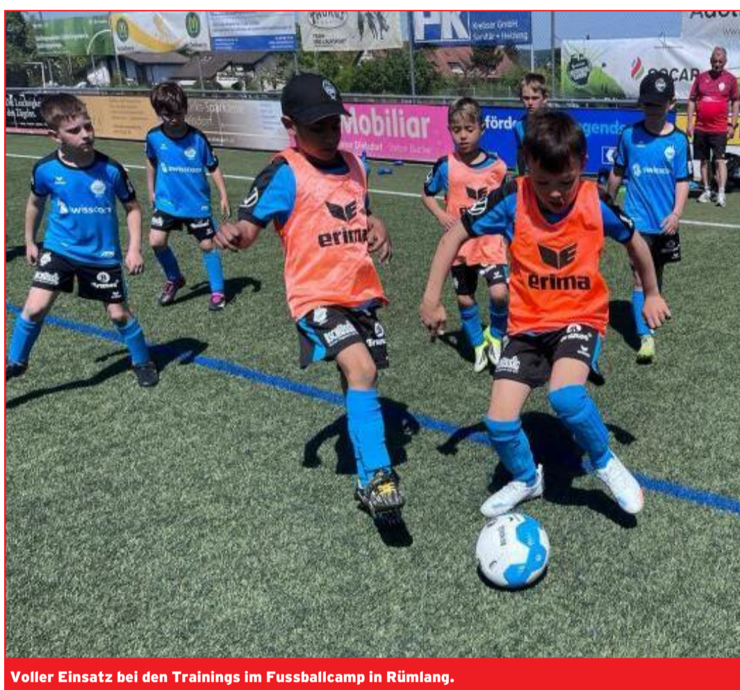
Voller Einsatz bei den Trainings im Fussballcamp in Rümlang.

Die Kinder und Jugendlichen im Alter von 6 bis 15 Jahren wurden während der gesamten Woche rundum betreut. Um das Angebot der Kinderbetreuung während der Schulferien für berufstätige Eltern weiter auszubauen, wurden die beiden Camps mit Zusatzbetreuung angeboten. Dadurch verlängerten sich die Betreuungszeiten von 8 Uhr bis 17.30 Uhr. Ein qualifiziertes Trainerteam leitete zwei Trainingseinheiten pro Tag und ermöglichte den Teilnehmenden, ihre sportlichen Fähigkeiten gezielt weiterzuentwickeln. Im Fussballcamp in Rümlang verbesserten die Teilnehmenden durch gezielte Übungen